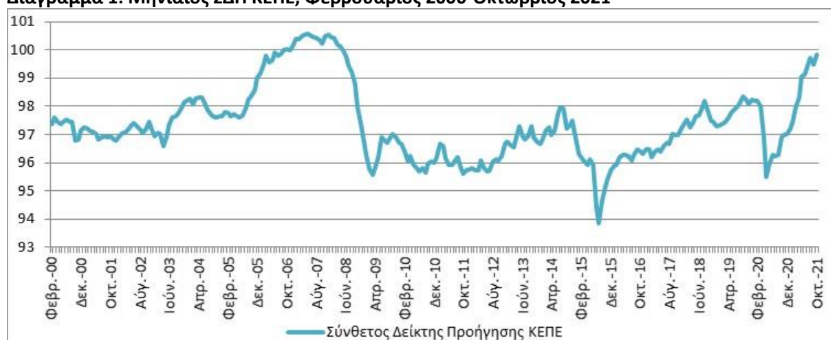
Διάγραμμα 1: Μηνιαίος ΣΔΠ ΚΕΠΕ, Φεβρουάριος 2000-Οκτώβριος 2021