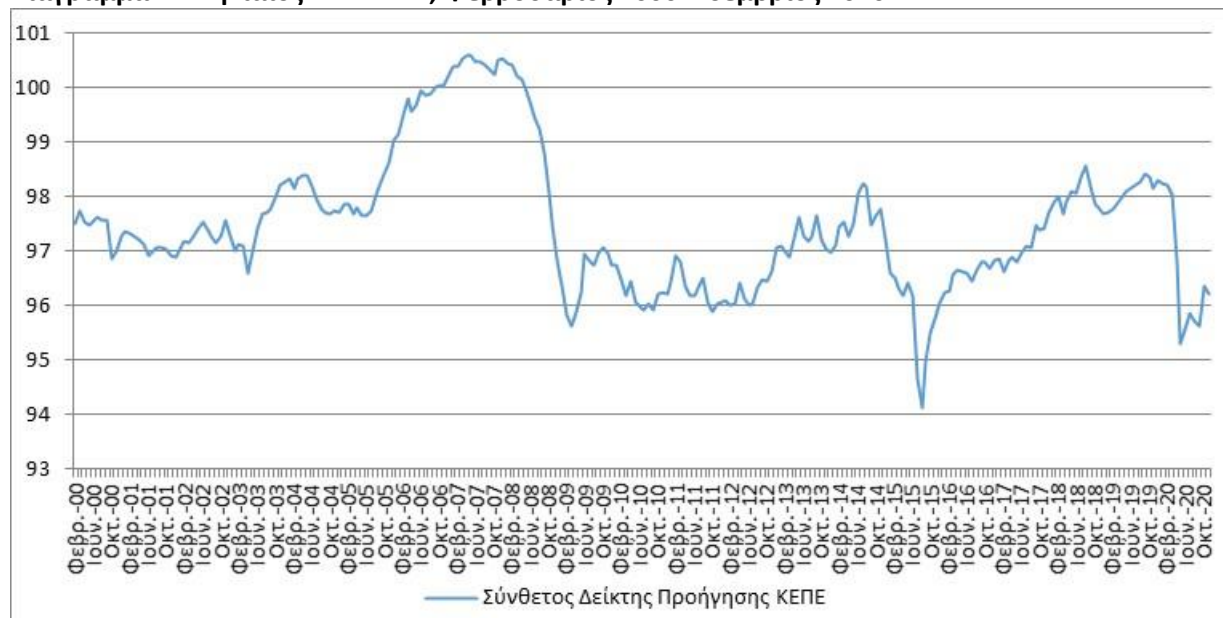
Διάγραμμα 1: Μηνιαίος ΣΔΠ ΚΕΠΕ, Φεβρουάριος 2000-Νοέμβριος 2020

Πρόκειται για έναν Σύνθετο Δείκτη Προήγησης (ΣΔΠ) βάσει ενός υποδείγματος δυναμικού παράγοντα, που κατασκευάζεται με τη χρήση έξι επιλεγμένων μηνιαίων οικονομικών μεταβλητών με χαρακτηριστικά προήγησης. Παρέχει πρόδρομες ενδείξεις για την πορεία και τις μεταστροφές στην ελληνική οικονομική δραστηριότητα, πριν από την αποτύπωσή τους στα τρέχοντα μεγέθη της συνολικής οικονομικής δραστηριότητας. Σύμφωνα με την πλέον πρόσφατη παρατήρηση για τον Νοέμβριο του 2020, 2 ο ΣΔΠ σημείωσε πτώση, σε συνέχεια της ανόδου της προηγούμενης περιόδου αναφοράς. Η εν λόγω κάμψη αντανακλά εν μέρει τη βραχυπρόθεσμη επιδείνωση των προοπτικών για την ελληνική οικονομία, εξαιτίας της επιβολής νέων έκτακτων μέτρων περιορισμού ή/και αναστολής της οικονομικής και κοινωνικής δραστηριότητας στη χώρα. Παράλληλα, ενσωματώνει την επίδραση της έλευσης του δεύτερου κύματος της πανδημίας Covid-19 που ενισχύει την απορρέουσα αβεβαιότητα αναφορικά με τη συνολική εξέλιξη της συνδεόμενης υγειονομικής κρίσης. Δεδομένης της έκτασης των περιοριστικών μέτρων και των αναμενόμενων επιπτώσεών τους, απαραίτητη καθίσταται η επανεκτίμηση του ΣΔΠ. Η ενσωμάτωση των νέων στοιχείων αναμένεται να καταδείξει τη συνέχιση ή μη των παρατηρούμενων τάσεων και να παράσχει επιπρόσθετες ενδείξεις για την πορεία της μελλοντικής εγχώριας οικονομικής δραστηριότητας.