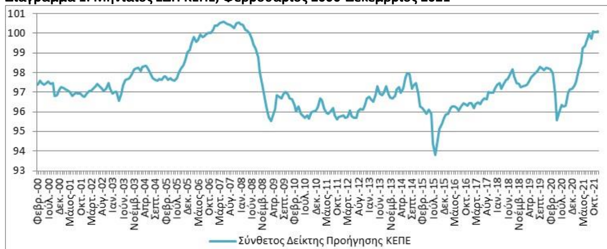
Διάγραμμα 1: Μηνιαίος ΣΔΠ ΚΕΠΕ, Φεβρουάριος 2000-Δεκέμβριος 2021